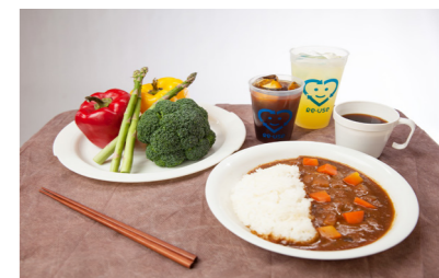
コップ1個使用でのCO2排出量 (kg)

A. 飲食を提供するイベントで、一番多く出るごみはプラスチック製などの 使い捨て容器 です。これを リユース食器 に替えることで、ごみの発生が抑制 ( リデュース ) され、環境にやさしいイベントになります!