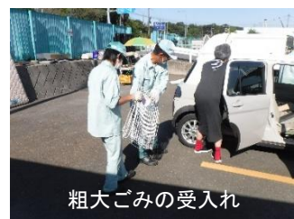
粗大ごみの受入れ