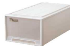
衣装ケース（長辺1m未満） 200円