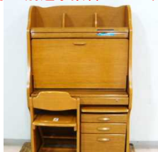
ライティングデスク（片袖） 1,000円