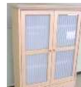
戸棚・棚（長辺1m未満） 200円