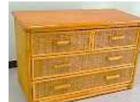
籐製タンス(長辺1m未満) 200円