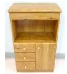
電子レンジ台(木製) 500円