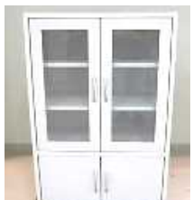
食器戸棚（長辺1m未満） 1,000円