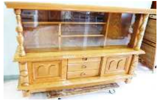
サイドボード(長辺1m未満) 1,000円