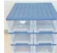
プラスチック製押入れタンス (長辺1m未満) 200円