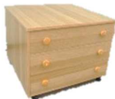
押入れたんす（長辺1m未満） 1,000円