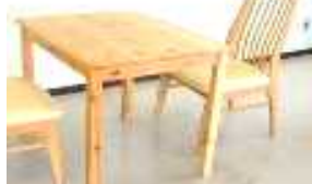
テーブル（長辺1m未満） 500円