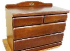
タンス（長辺1m未満） 1,000円