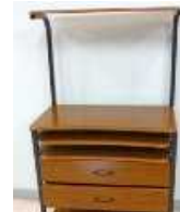
パソコンラック（長辺1m未満） 200円