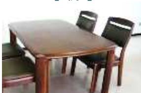
テーブル（長辺1m以上） 1,000円