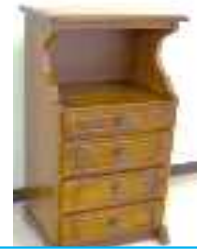
電話台(長辺1m未満) 200円