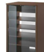
オーディオラック 500円