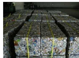
圧縮された資源物（缶）