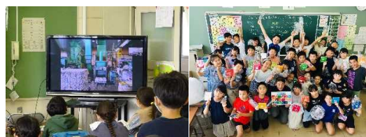
オンライン社会科見学