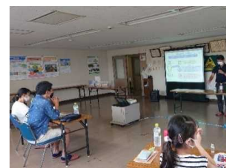
自主企画イベント （夏休み環境講座）