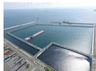
南本牧廃棄物最終処分場 （第5ブロック）

※神明台処分地及び南本牧廃棄物最終処分場（第2ブロック）では、廃棄物の受入や埋立に関する業務（受付審査業務、受入検査、計量・手数料徴収業務、埋立計画の策定、埋立業務及び情報提供業務）は実施しません。