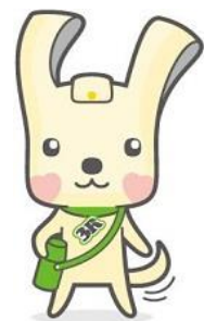
「ヨコハマ3R夢（スリム）！」 マスコット イーオ