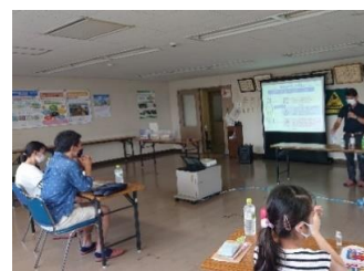
自主企画イベント （夏休み環境講座）