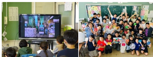
オンライン社会科見学