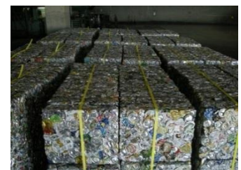
圧縮された資源物（缶）