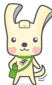
「ヨコハマ3R夢（スリム）！」 マスコット イーオ