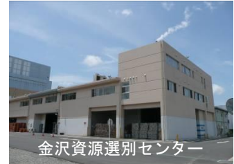
金沢資源選別センター

また、4箇所の資源選別施設を一括管理しており、効率的な事業運営はもとより、これまでの経験及びノウハウを活かした様々な取組を行います。