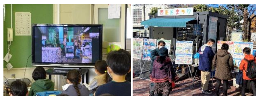
オンライン社会科見学