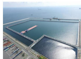
南本牧廃棄物最終処分場 （第5ブロック）

※南本牧廃棄物最終処分場（第2ブロック）、神明台処分地、川井処分地、下川井処分地、東本郷処分地及び長坂谷処分地では、廃棄物の受入や埋立に関する業務（受付審査業務、受入検査、計量・手数料徴収業務、埋立計画の策定、埋立業務及び情報提供業務）は実施しません。