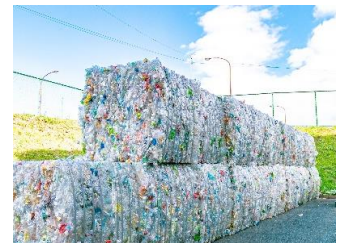
圧縮した資源物 (ペットボトル)