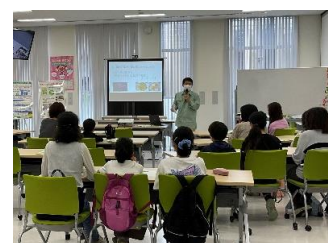
啓発イベント (子ども環境講座)