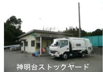
神明台ストックヤード