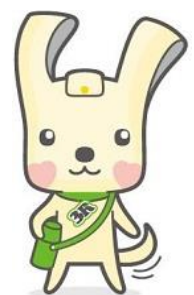
横浜市資源循環局 マスコット「イーオ」