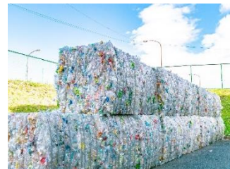
圧縮した資源物 （ペットボトル）