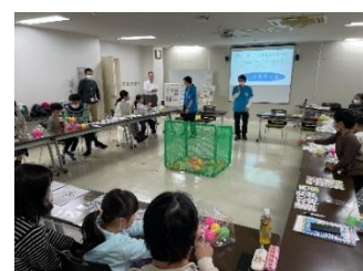
啓発イベント （エコキッズ講座）