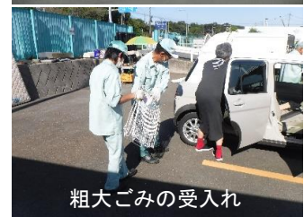
粗大ごみの受入れ