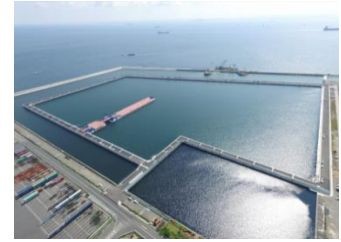
南本牧廃棄物最終処分場 （第5ブロック）

横浜市の廃棄物最終処分場（南本牧廃棄物最終処分場（第5ブロック・第2ブロック）、神明台処分地、川井処分地、下川井処分地、東本郷処分地、長坂谷処分地及び新橋処分地）の適正な管理及び関連する業務を一体的に実施することにより、長期的に安定した廃棄物処理を推進します。