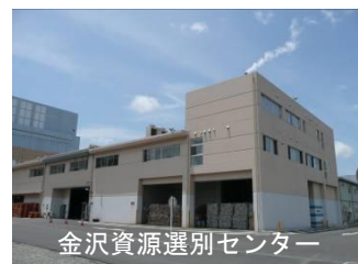
金沢資源選別センター

また、4箇所の資源選別施設を一括管理しており、効率的な事業運営はもとより、これまでの経験及びノウハウを活かした様々な取組を行います。