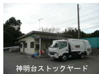
神明台ストックヤード

※長坂谷ストックヤードのみの回収品目（プラスチック製容器包装、小さな金属類、使用済み乾電池、スプレー缶及び燃えないごみ）を合わせた計画量です。