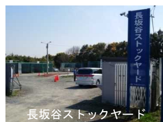
長坂谷ストックヤード