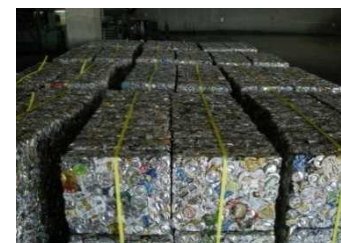
圧縮された資源物（缶）