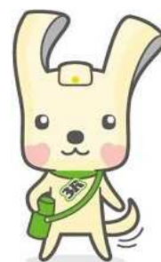
「ヨコハマ3R夢（スリム）！」 マスコット イーオ