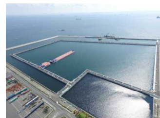
南本牧廃棄物最終処分場 （第5ブロック）

※神明台処分地及び南本牧廃棄物最終処分場（第2ブロック）では、廃棄物の受入や埋立に関する業務（受付審査業務、受入検査、計量・手数料徴収業務、埋立計画の策定、埋立管理及び情報提供業務）は実施しません。