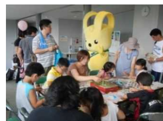
自主企画イベント